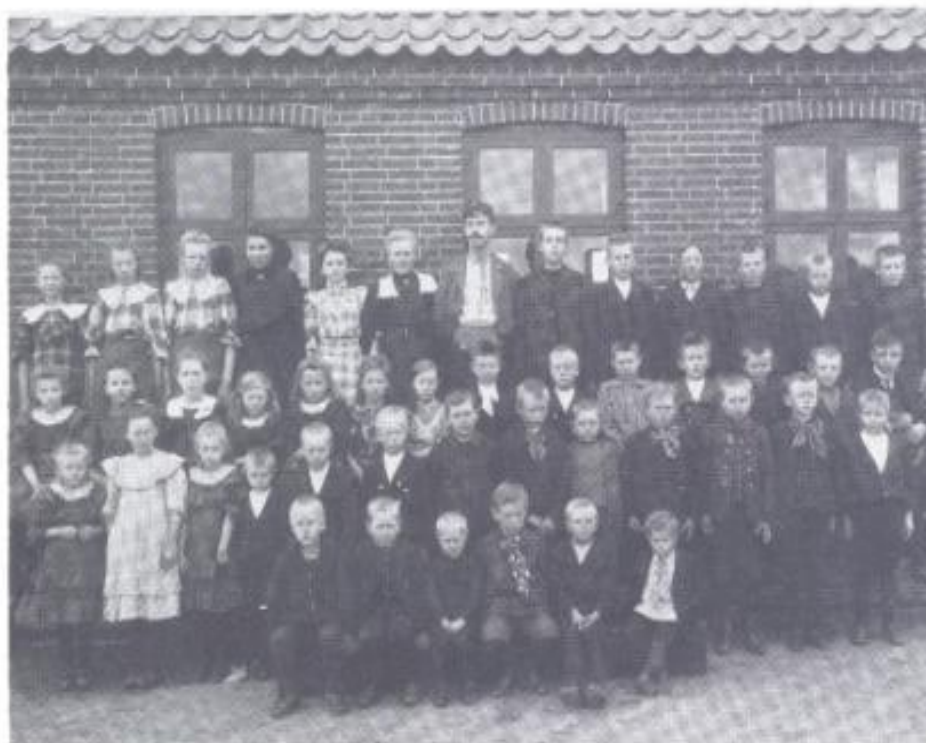
Hyllebjerg skole, ca. 1907

Fire år før lærer Poulsen kom til Hyllebjerg skriver præsten i sin konseptbog om Hyllebjerg skole, at den er meget forfalden og for børnene sundhedsfarlig. En ombygning var bestemt allerede i 1854, med modstand fra Holmgårdsmændene, der ønskede skolen flyttet mod øst, havde til følge, at skolestuen først blev ombygget i 1858 og boligen ombyggedes i 1868. I 1902-1903 opførtes en ny skolestue ved skolens østre ende, og den gamle skolestue i vestre endt blev så lavet til beboelse. Også denne gang ville holmgårdsmændene have skolen flyttet, hvilket havde til følge, at byggeriet forhalede i 2 år.